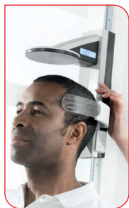
La taille déterminée est indiquée sur l'affichage intégré à l'appuie-tête du curseur.

Un argument de poids plaçant en faveur de la station de mesure seca 285 est sa vaste plage d'utilisation. De la pédiatrie à la néphrologie en passant par la cardiologie, elle permet non seulement de peser et de mesurer les personnes corpulentes pesant jusqu'à 300 kg, mais également les tout-petits. Ceci grâce à sa large plage de mesure de la taille variant de 30 à 220 cm. La stabilité inébranlable seca caractérise également ce modèle : plateforme en verre, butée de talon et toise robuste en aluminium de qualité supérieure.