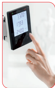
La transmission des résultats à une imprimante seca 360° wireless ou à un ordinateur s'opère grâce à une seule touche de l'affichage tactile multifonctionnel particulièrement facile à nettoyer.