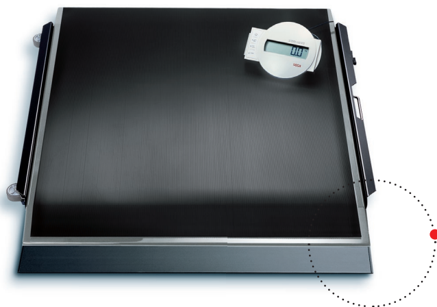
Im Lieferumfang ist eine Rampe zum leichten Auffahren von Rollstühlen enthalten.