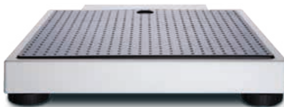
Kompakte Bauweise und niedriges Gewicht für einfachen Transport und universellen Einsatz.