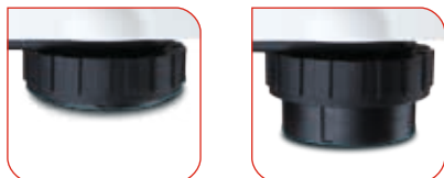
Nivellierfüße an der Unterseite der Wiegebasis für sicheres Aufstellen.

Die seca 899 verfügt über alle Funktionen, die häufig benötigt werden: Die BMI-Funktion zur Ermittlung des Ernährungszustands, die HOLD-Funktion für das Festhalten des Messergebnisses und die TARA-Funktion zum Trieren des Gewichts z.B. von Kleinkindern auf dem Arm ihrer Eltern. Das Ablesen der ermittelten Daten geht leicht, denn das separate Display ist groß und sein Neigungswinkel stufenlos verstellbar.