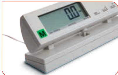
Stufenlos im Winkel verstellbares Anzeige und Bedienelement für Tischaufstellung oder Wandbefestigung.